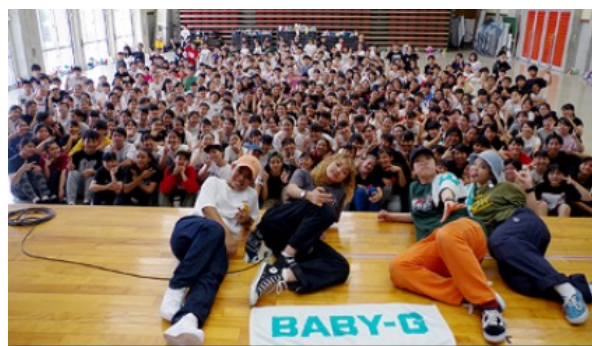
RUSH BALLダンスワークショップ