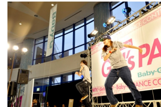
BABY-Gダンスコンテスト