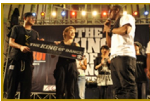
OMARIONダンスコンテスト