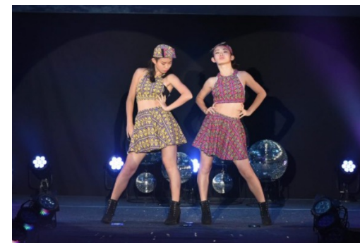
ファッションショー